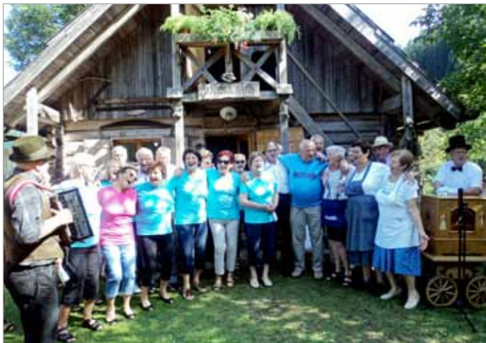
Vlcerska bajta gosti številne dogodke, predavanja, praznovanja in srečanja