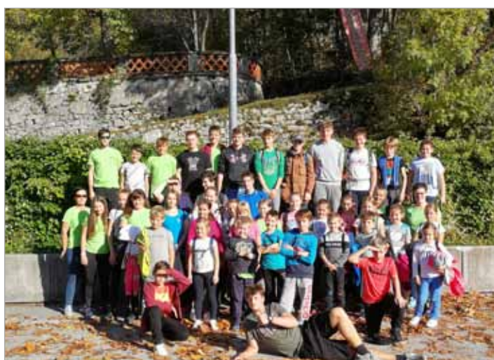
... in v nadaljevanju dvigali raven adrenalina v pustolovskem parku

Leto 2019 je bilo za nas res uspešno leto. Ekipama mladink in mladincev so se pridružile tri desetine: pionirke, pionirji ter pripravniki, ki so uspešno opravili izpit za gasilca pripravnika. Uspešno leta smo v oktobru zaključili z izletom v Postojno, kjer smo si ogledali Gasilsko-reševalni center in obiskali Pustolovski park Postojna.