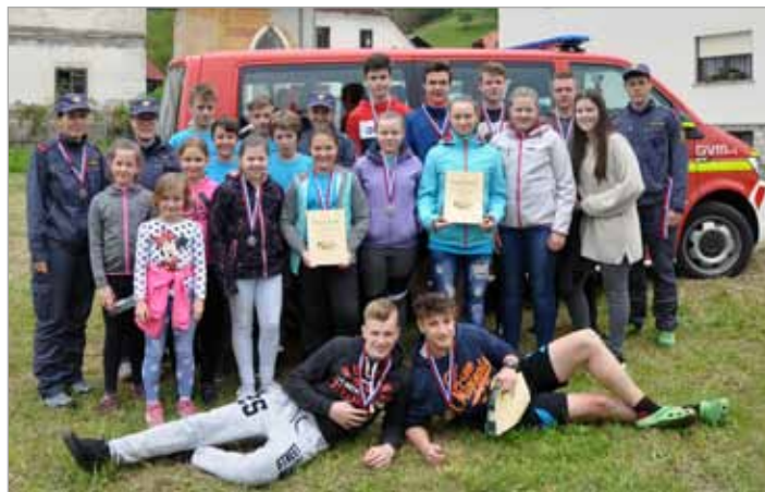
Mladinke in mladinci se pod vodstvom mentorjev udeležujejo različnih tekmovanj, kjer dosegajo lepe rezultate