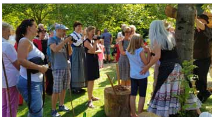
Obiskovalci so lahko spoznali in v praksi izkusili nekaj zanimivih in nenavadnih zdravil ter zagovorov