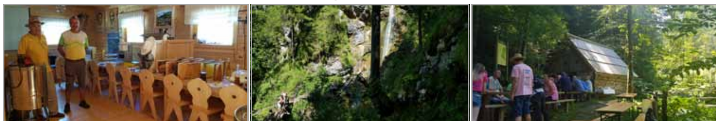
Dan odprtih vrat v čebelarstvu centru