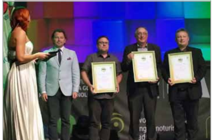
Prejemniki priznanj v kategoriji najbolj urejenih in gostoljubnih izletniških krajev: Mojstrana, Luče in Park Škocjanske jame

Osnovni nosilec projekta je Turistična zveza Slovenije. Tekmovanje se prične na lokalni ravni z ocenjevanjem najbolj urejenih hiš, poslopij, vrtov, balkonov in se nadaljuje na krajevni, mestni, občinski ravni ter zaključuje na državnem nivoju z razglasitvijo najbolj urejenih in gostoljubnih mest