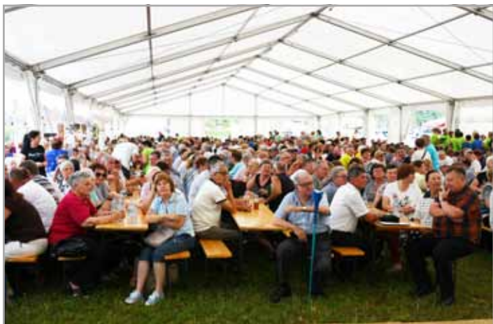
Na srečanju v Lučah se je zbralo več kot tisoč obiskovalcev

Zveza delovnih invalidov Slovenije je v letu 2019 praznovala 50 let delovanja. Zaključno praznovanje ob jubileju so pod naslovom Praznujemo preteklost, izboljšujemo prihodnost pripravili v sodelovanju z Občino Luče, medobčinskim društvom Zgornje Savinjske doline ter krovno organizacijo v Lučah, in sicer prvo soboto v juliju.