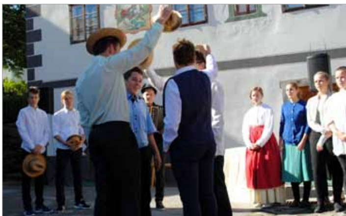
Učenci skupaj s svojimi mentorji sodelujejo v različnih projektih in popestrijo mnoge dogodke v kraju

Vsakodnevno delo smo pogosto popestrili s številnimi kulturnimi prireditvami v šoli in kraju. Na teh srečanjih učenci in otroci iz vrtca prikažejo svoje glasbene, recitatorske, ustvarjalne ... talente. Pred vsakim državnim praznikom smo izvedli krajšo kulturno prireditev, učenci pa so nastopili tudi na številnih dogodkih v kraju (praznovanje 40-letnice Koče na Loki, prireditev za ostarele, božični koncert, literarni večer ob mesecu kulture, zbor veteranov vojne za Slovenijo, otvoritev pohodniškega festivala, 100-letnica čebelarjenja in razvitje prapora, srečanje delovnih invalidov Slovenije, Lučki dan, vstop Luč v gorniško vas ...). Aktivni so bili dramski igralci, ki so na srečanju gledališčnikov KLIPE KLOPE v Šmartnem ob Paki odigrali Disnejeve zmešnjave, na zaključni akademiji pa so uprizorili Kralja Matjaža.