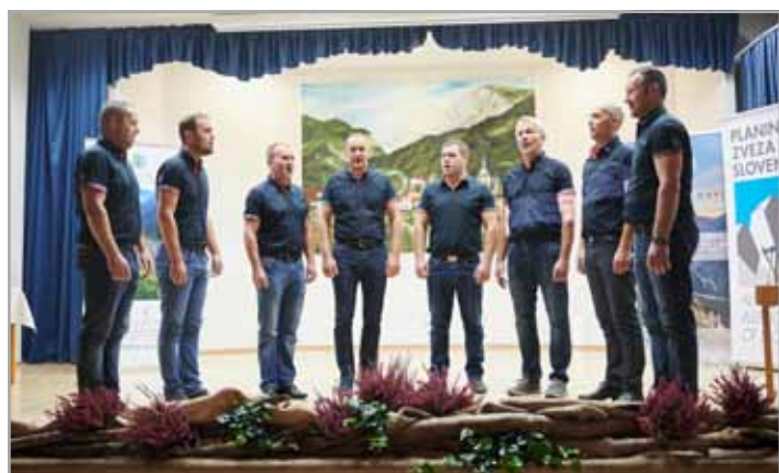
Slovesnost je lepo dopolnil bogat kulturni program vsebinsko vezan na lepote Luč in okoliških gor