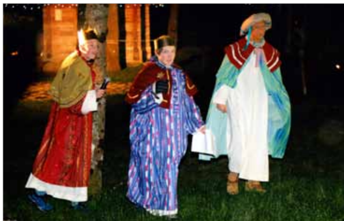
Božična zgodba v čudovitem ambientu pri etno hiškah je bila res nekaj posebnega