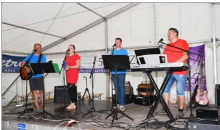
Za zasedenost plesišča so skrbeli člani Ansambla Ojstrica