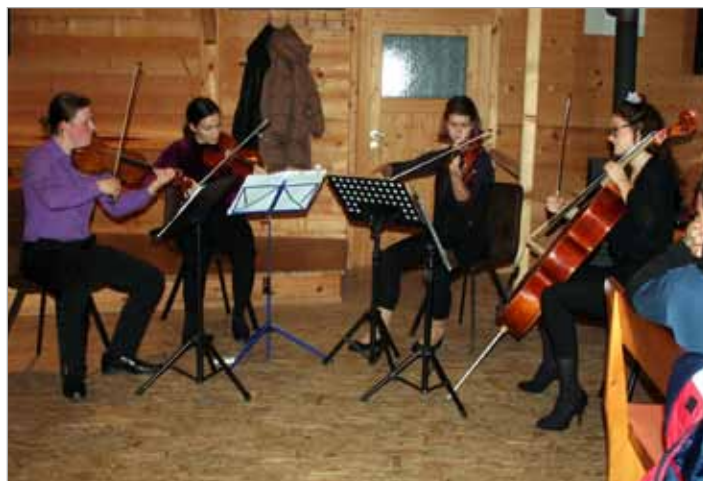
V božičnem času so poslušalci spoznavali svet resne glasbe