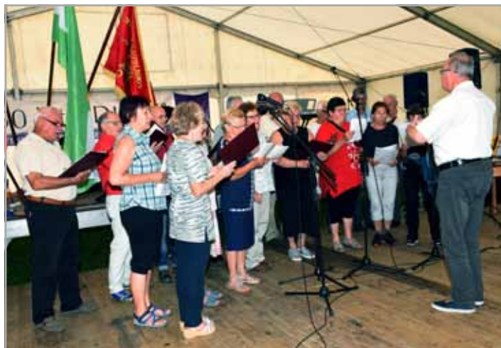
Na prireditvi je zapel tudi Mešani pevski zbor upokoencev in invalidov Mozirje

Po okrepčilu so se številni obiskovalci lahko družili ob družabnih igrah, v farni cerkvi je bila maša, na ogled pa so bile tudi etno hiške na jezu.