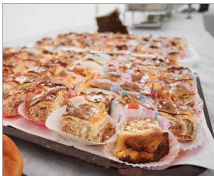
Razvajanje brbončic ob okusnih domačih jedeh