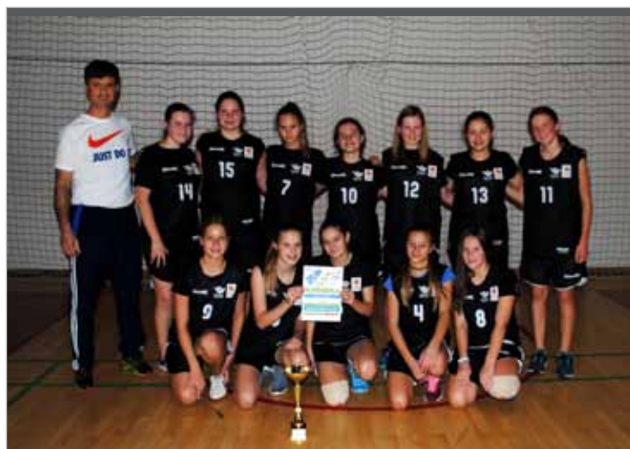
Veselje starejših deklic in njihovega mentorja po osvojenem 1. mestu na medobčinskem tekmovanju v košarki