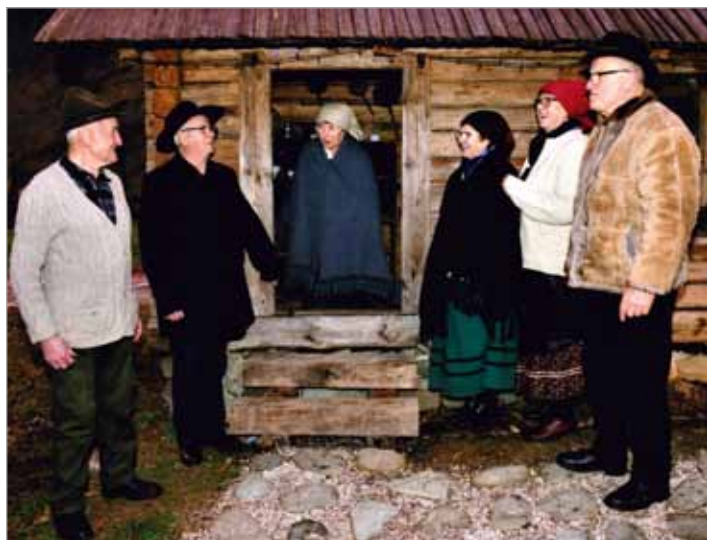
Uprizoritev svetopisemske božične zgodbe v etno vasi ob reki Savinji je številnim obiskovalcem popestrila praznične decembrske dni

Uprizoritev živih jaslic v sredo, 25. 12. 2019, in v petek, 27. 12. 2019, prvič v tem lepem okolju.