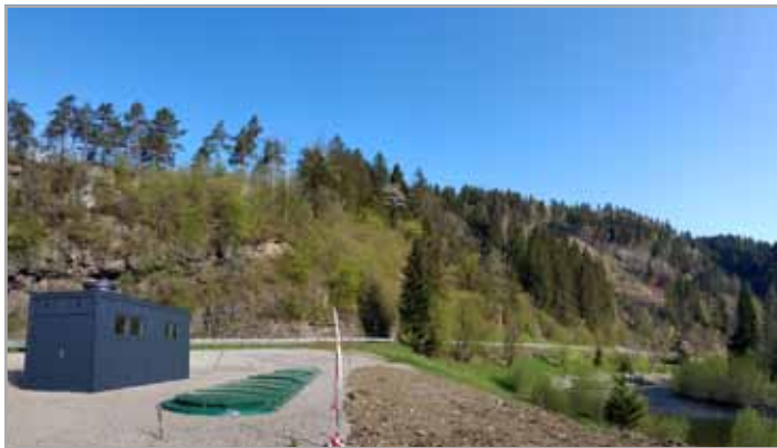
Nova čistilna naprava poskusno že obratuje

Pri pridobivanju soglasij, predvsem vodnega soglasja, se je zadeva zelo zapletala, tako da smo vodno soglasje pridobili šele v letu 2015. Zaradi tega smo zamudili vse roke, da bi lahko izgradnjo nove čistilne naprave prijavili na razpis za kohezijska sredstva v obdobju 2007–2013. Ker kasneje ni bilo na voljo nepovratnih sredstev, smo zadevo prelagali, dokler je obstoječa čistilna naprava še zadovoljivo delovala. V letu 2018 pa je tudi inšpektorat za okolje od nas zahteval ureditev čiščenja odpadnih vod.