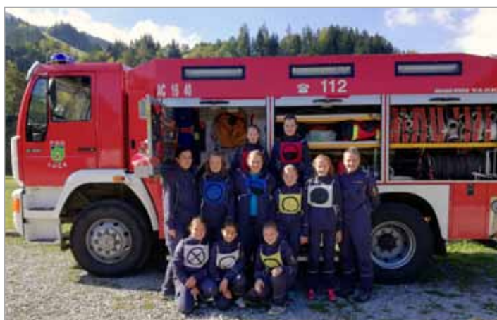
Mlade gasilke PGD Luče skupaj z mentoricama

Sedaj lahko učenci telovadijo v novi, moderno opremljeni telovadnici in verjamem, da bomo z njo tako pri naši mladini kot vseh drugih občanov še spodbudili veselje do športa in tako še podkrepili zdrav način življenja. Učenci in mentor pa so za vse uspehe v šolskem letu 2018/19 prejeli tudi Priznanje Občine Luče.