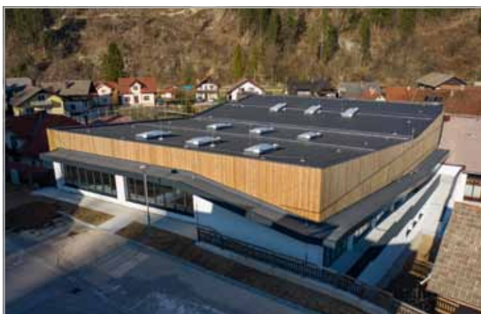
Nov športni center je umeščen v samem središču vasi

V letu 2015 se je razmišljalo o izgradnji novega športnega igrišča zunaj centra Luč in ob tem se je tehtalo, kaj je bolj smiselno, ali izgradnja novega igrišča na Hočevarjevi njivi ali nove telovadnice. Obstoječa je bila za potrebe šole premajhna, potrebna pa je bila tudi obnove. Občinski svet se je nato odločil, da se zgradi nova telovadnica. S tem so se problemi šele pričeli pojavljati. Kako velik naj bo ta objekt, kako ga umestiti v prostor itd. Vprašanj je bilo zmeraj več kot odgovorov.