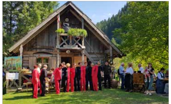
Članice Društva upokojencev Vodice so pripravile zanimiv plesno pevski nastop