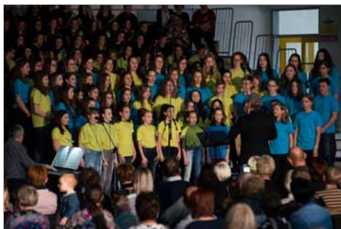
Otroški pevski zbor ter združeni Mladinski pevski zbor OŠ Luče in OŠ Ljubno med nastopom na pevski reviji CICIDO v Mozirju