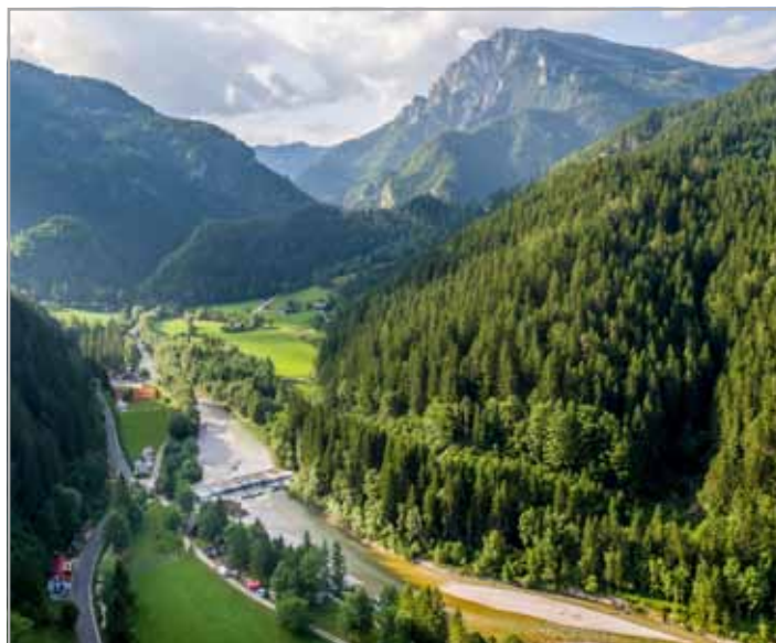
Novo koncertno prizorišče je ponudilo čudovito kuliso