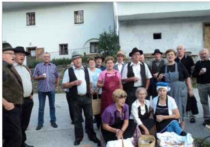
Oživljanje tradicije petja v Lučah s prireditvijo Petje po vasi

V sklopu tega jubileja smo upokojenci na sobotni večer, 3. avgusta, poskrbeli za popestritev dogajanja v kraju s prireditvijo Petje po vasi, s katero smo na višku turistične sezone oživili tradicijo petja v Lučah.