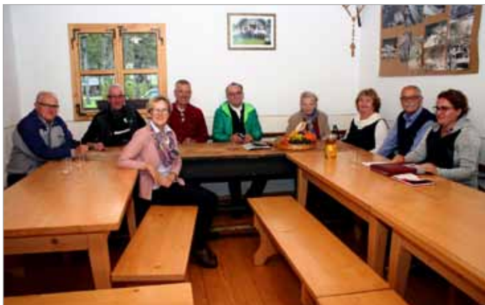
Sestanek in druženje članov kulturnega društva SLAP

Literarno srečanje članov kulturnega društva SLAP v Lučah (9. oktobra.) z razširjenim sestankom za člane pred izidom letnega zbornika pesmi in kratko druženje.