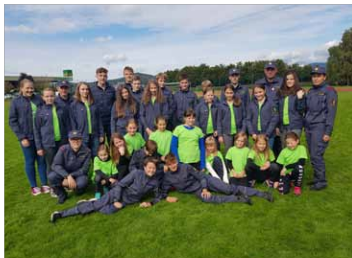
V PGD Luče skrbijo tudi za gasilski podmladek