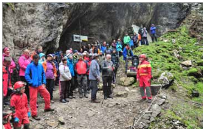
Številni obiskovalci so pred vhodom prisluhnili kratki zgodovini kluba in Snežne jame

Poleg osrednje slovesnosti ob vstopu v mrežo Gorniških vasi so v Lučah pripravili tudi nekaj spremljevalnih dogodkov. Dobro je bil obiskan pohod po okolici Luč s ciljem pri etno hiškah, kjer je bil voden ogled muzejske zbirke in so bili pohodniki tudi pogoščeni. Veliko zanimanja pa je bilo tudi za prireditev Dan odprtih vrat Snežne jame, ki so jo člani Jamarskega kluba Črni galeb iz Prebolda združili s praznovanjem svoje petdesetletnice.