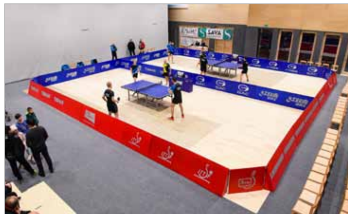
NTK Interdiskont iz Raven na Koroškem je bila prva gostujoča ekipa na domačem parketu

V četrtek, 23. 1. 2020, je v 1. krogu letošnje 1. slovenske namiznoteniške lige v goste v Luče prišla odlična ekipa NTK Interdiskont iz Raven na Koroškem, ki je v preteklih letih redno krojila vrh slovenskega namiznega tenisa.