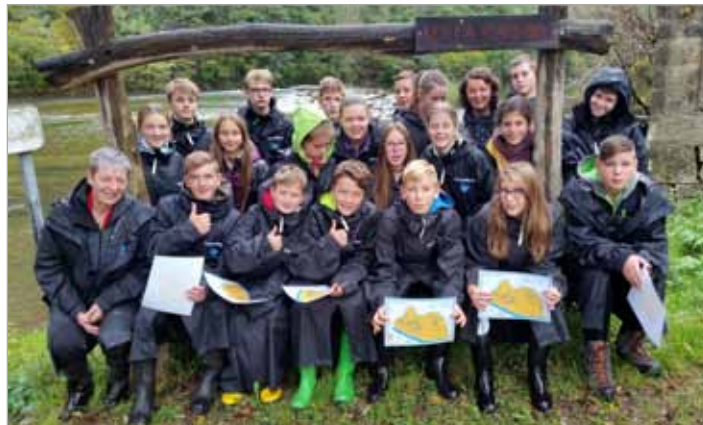
Osmošolci so v šoli v naravi spoznavali značilnosti in posebnosti Bele krajine