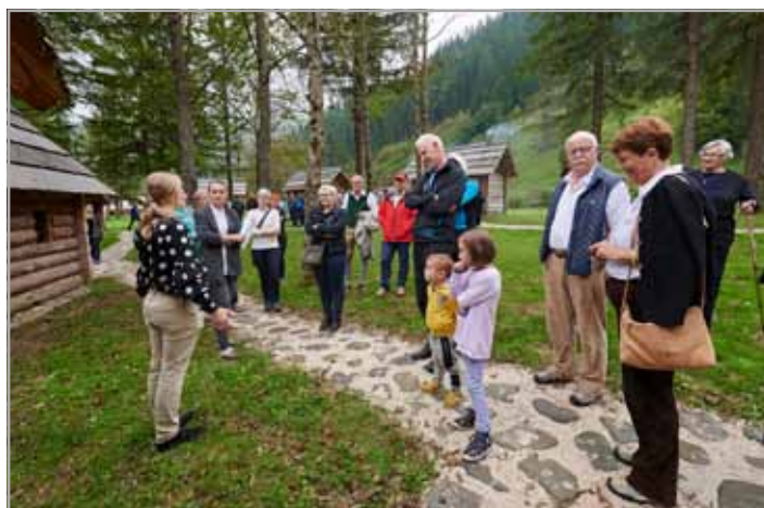
... in si po okrepčilu in počitku v Vlcerski bajti ogledali še muzej starih obrti

Samo slovesnost je spremljal bogat kulturni program v izvedbi domačih pevcev, glasbenikov in plesalk. Pesmi in ples so bili tako kot vezno besedilo vsebinsko povsem vezani na zgodbe, ki so jih v preteklosti različni avtorji napisali o lepoti Luč in okoliških gora in jih objavili bodisi v Planinskem vestniku ali drugih časopisih ter na tukajšnje legende, kar je lepo zaokrožilo in popestrilo uradni del dogodka.