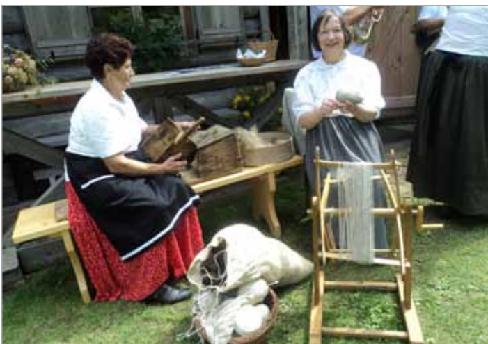
Pri upokojencih si je bilo moč ogledati tudi stara opravila in orodja ter okusiti nekaj tradicionalnih lokalnih jedi

Nedeljsko popoldne na 50. Lučkem dnevu je bilo pri Vlcerski bajti usmerjeno v srečanje z izročilom preteklosti in v druženje. Upokojenci smo organizirali prikaz starih opravil, in sicer krtačenje in predenje volne, pletenje košar, košev, brušenje nožev, klepanje kose in srpov, delo vlcerjev na riži in pri skorjevki. Postavili smo razstavo vlcerskega orodja in iz življenja vlcerjev. Obiskovalcem smo ponudili nekaj iz tradicionalne kulinarične ponudbe (šnite, masunek, grumpe, kruh iz krušne peči, flancate, hršoče krape, »ta staro« potico, platičke ...).