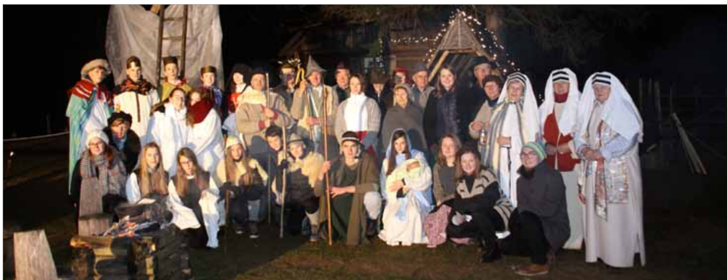
Več kot 60 posameznikov je soustvarjalo in uspešno izpeljalo uprizoritev živih jaslic

/.../ Dober glas o nas je segel tudi v Slovenske novice, Savinjske novice, Kmečki glas /.../