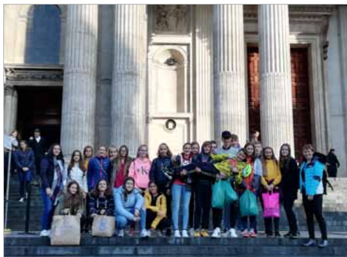
Devetošolci so raziskovali evropsko prestolnico London