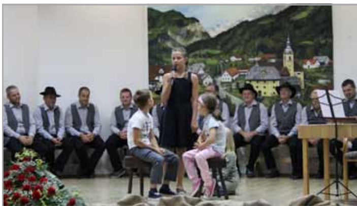
Osnovnošolci so kulturni program začinili s kratkim skečem