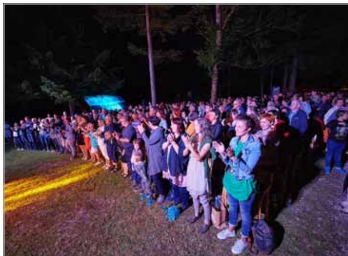
Navdušeno občinstvo je nastopajoče nagradilo s stoječimi ovacijami