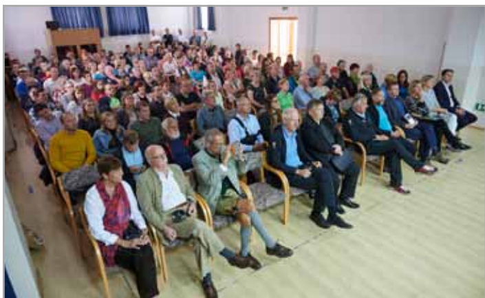
Slovesnosti so se udeležili številni gostje od blizu in daleč