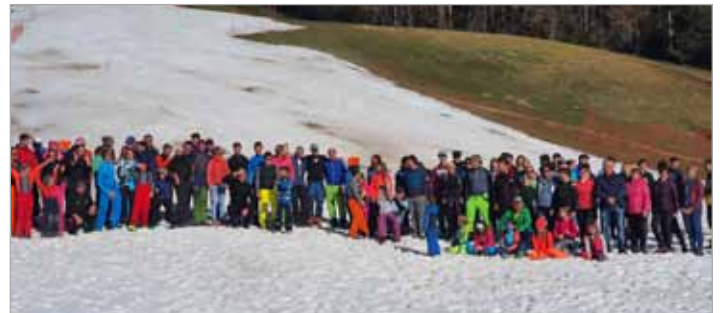
Na tradicionalni Tekmi med zaselki je letos zmagal zaselek Krnica

Ob zaključku sezone je Smučarsko-tekaško društvo Luče v sodelovanju z Občino Luče organiziralo tradicionalno Tekmo med zaselki. Zmagal je zaselek Krnica, na drugo mesto se je uvrstil zaselek Luče, tretja pa je bila ekipa Za vedno Lučani. Ob koncu je bilo žrebanje bogatih praktičnih nagrad. Za odlično vzdušje so poskrbeli tekmovalci in navijači.