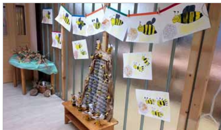
Projekt Tradicionalni slovenski zajtrk so najmlajši obeležili z ustvarjanjem panja in čebelic

Vrtec je v preteklem šolskem letu obiskovalo 63 otrok v Lučah (26 otrok v I. starostnem obdobju, 37 otrok v II. starostnem obdobju) in 20 otrok v Solčavi.