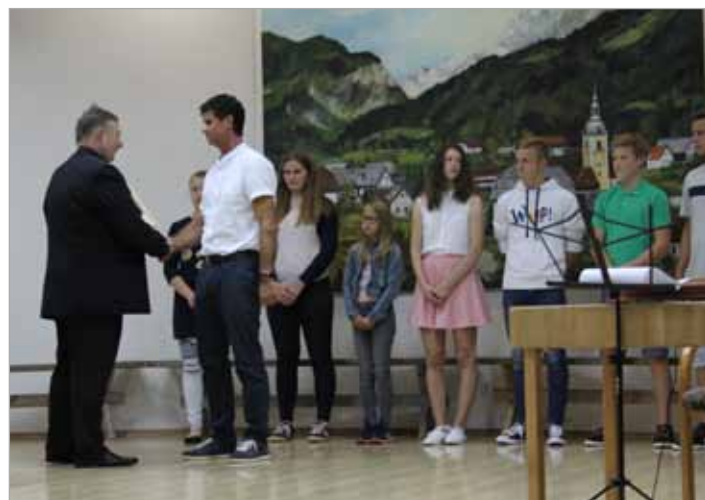
Učenci in mentor so za številne športne uspehe prejeli priznanje Občine Luče

V zahvalo in spodbudo za dolgoletno uspešno delovanje se je Občina Luče Šolskemu športnemu društvu zahvalila s podelitvijo Priznanja Občine Luče.