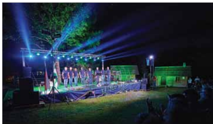
Fantastično prizorišče in nepozaben koncert - Kresna noč 2019

Tradicionalni koncert Okteta Žetev z gosti na kresni večer , prvič organiziran na tej lepi lokaciji (zaradi gradnje športne dvorane). Zaradi bogatega programa, nastopajočih ter izjemnega obiska in vzdušja je bil res nepozabni dogodek.