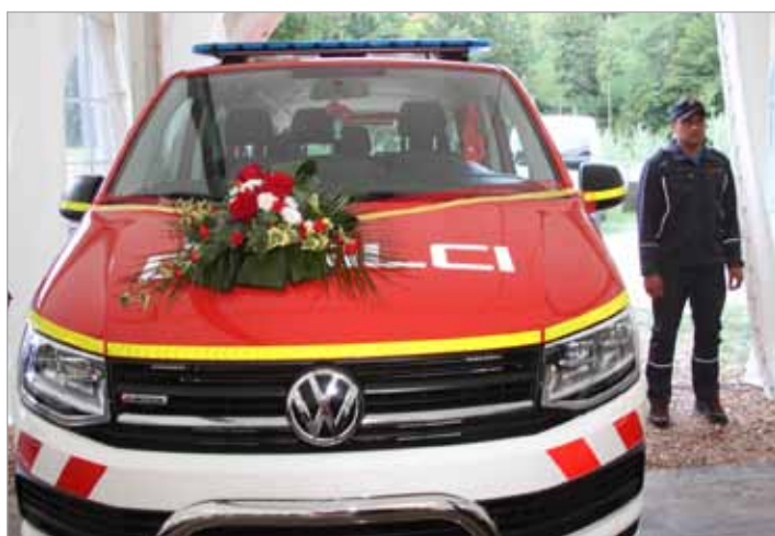
Domači gasilci so avgusta 2019 slovesno predali svojemu namenu novo gasilsko vozilo

V prostovoljnem gasilskem društvu Luče aktivno delujejo operativna enota, veterani, članice in mladina. Člani smo bili v letu 2019 aktivni na vseh področjih, ki nam jih narekujejo pravila gasilske službe – intervencije, prevozi pitne vode, opravljanje redarske službe, tekmovanja in izobraževanja. Stremimo k ciljem, da smo vsak dan boljši, s čim več znanja in dobro opremo, zato smo 10. avgusta svojemu namenu predali novo gasilsko vozilo za prevoz moštva. Po uradnem delu smo imeli veselico z Ansambлом Gadi.