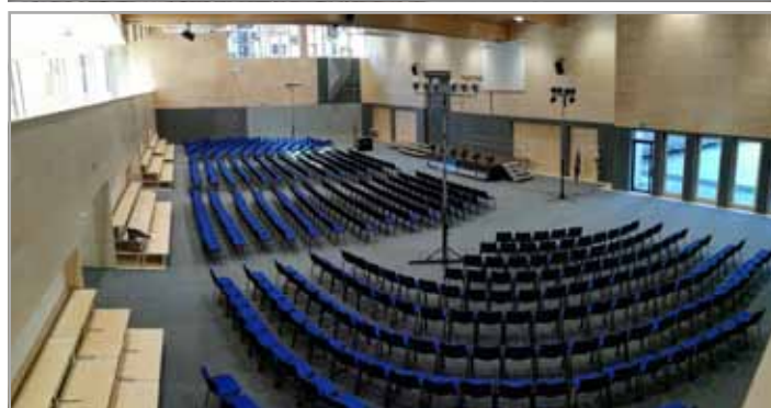
Dvorana bo služila za športni pouk šolarjev ter kot rekreacijski in prireditveni prostor

dokler ni bil objavljen razpis na Ministrstvu za izobraževanje, znanost in šport, na katerem so razpisali nepovratna sredstva za gradnjo športnih objektov.