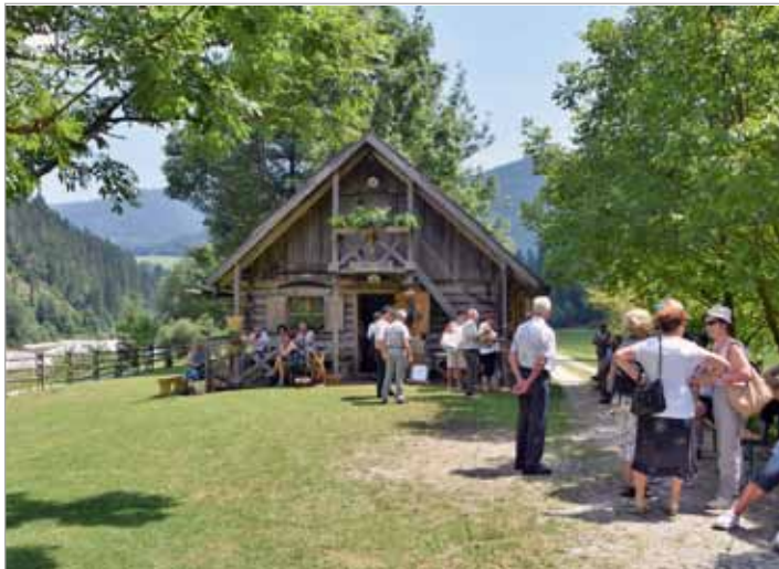
Udeležencem srečanja delovnih invalidov Slovenije so upokojenci pripravili poseben spremljevalni program

Dan odprtih vrat v bajti za obiskovalce srečanja članov društev invalidov Slovenije v Lučah, ki je potekal 6. julija. Upokojenci smo jim pripravili priložnostni program, organizirali »taksi« službo za obiske njihovih skupin, pogostitev in zagotovili zainteresiranim vodene ogledе dediščine.