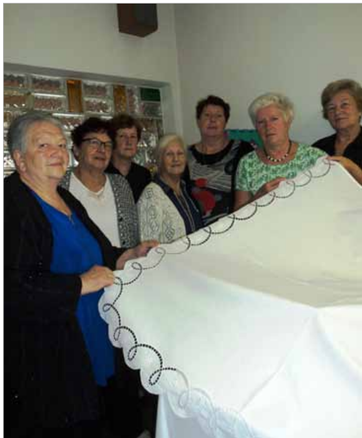
Članice skupine za ročno delo so spet izvezle nekaj lepega za skupno dobro

V lanskem občinskem glasilu sem napisala prispevek o posebni skupini ljubiteljic ročnega dela, ki se že več kot deset let dobiva tedensko v hiški dobrotelčnosti, o njihovem ustvarjanju in spominih.