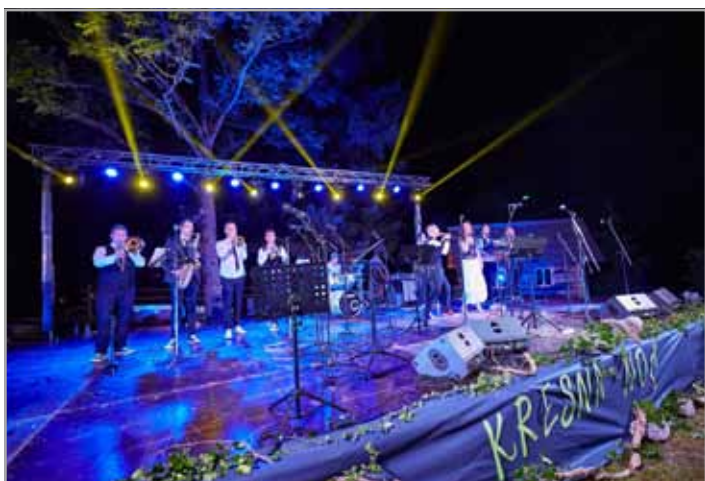
Zabava s Skorbandom se je nadaljevala dolgo v noč