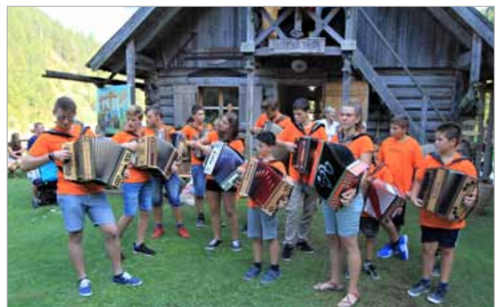
Nedeljsko dogajanje pred Vlcersko bajto so dodatno popestrili mladi harmonikaši