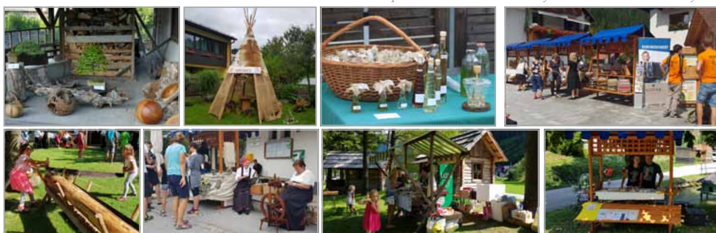
Prireditev "Od štanta do štanta" po vasi