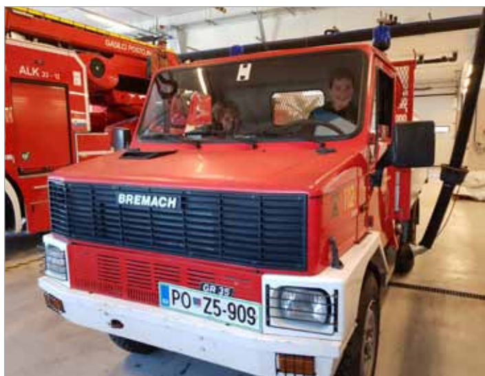
Na izletu v Postojni so si najprej ogledali sodoben gasilsko-reševalni center ...