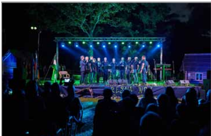
Sijajno režirana osvetlitev doda večeru poseben čar