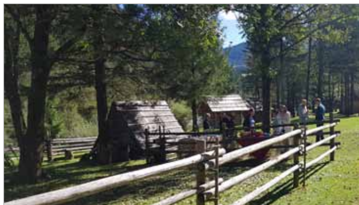
V Vlcerski bajti so potekale različne aktivnosti povezane z vključevanjem Občine Luče v mrežo Gorniške vasi