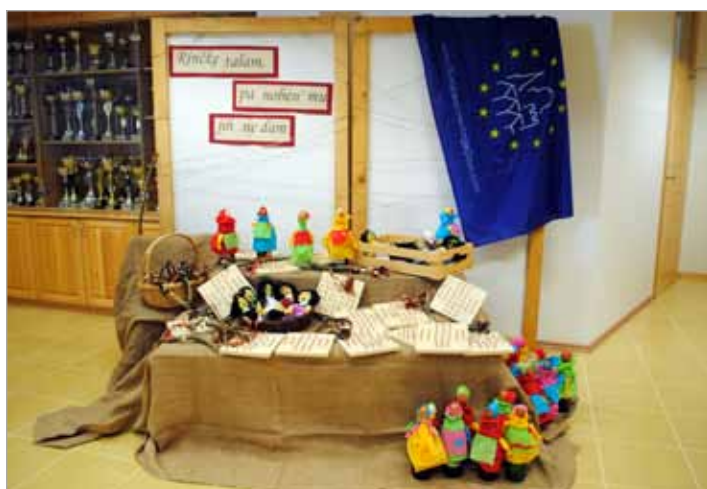
Odkrivanje preteklosti domačega kraja v okviru projekta Dediščina gre v šole

zelo razveselil podatek, da se je v lanskem šolskem letu povečal obisk šolske knjižnice, kar pomeni, da mladi še znajo ceniti pomen literature. Učenci so sodelovali tudi na več likovnih natečajih, najodmevnejšo nagrado pa so prejeli na natečaju PRAZNIK KOŠARKE, ki ga je organizirala Košarkarska zveza Slovenije; učenke so prejele 3. nagrado (reprezentančni dres Luke Dončiča in maskoto Lipka ter plakat). Učenci so skupaj s svojimi mentorji sodelovali tudi na Drobthinici, izvedli smo božični bazar, devetošolci so izdelovali novoletne voščilnice in adventne venčke. Pri teh aktivnostih smo bogatili šolski sklad, devetošolci pa so si prislužili denar za zaključno ekskurzijo in valetu.