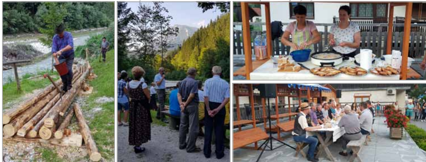
Otvoritev riže za spravilo lesa pri Vlcerski bajti