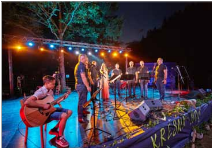
Oktet Žetev na svojem vsakoletnem koncertu gosti odlične glasbene goste

Na predvečer dneva državnosti člani Okteta Žetev že tradicionalno pripravijo koncert ob kresni noči. Letošnjega, ki je bil peti po vrsti, so naslovili »Oktetova čista petka« in lahko rečemo, da je bila organizacija, izvedba in vzdušje res za čisto petko.