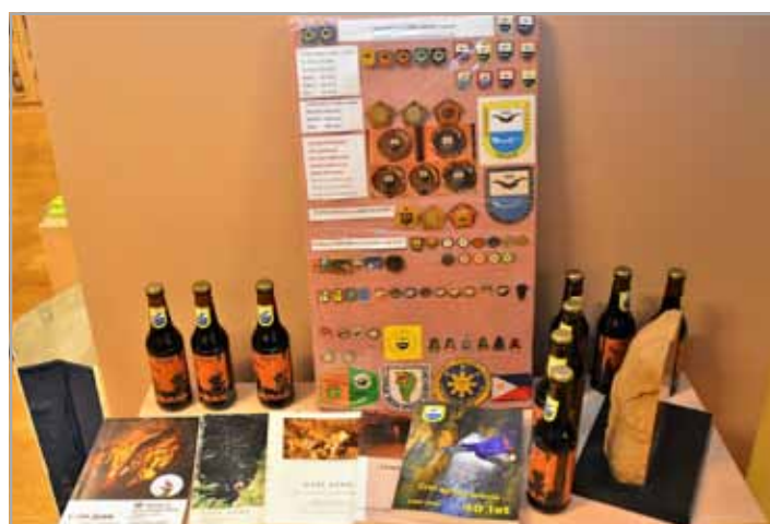
Pogled na del razstave v knjižnici Prebold