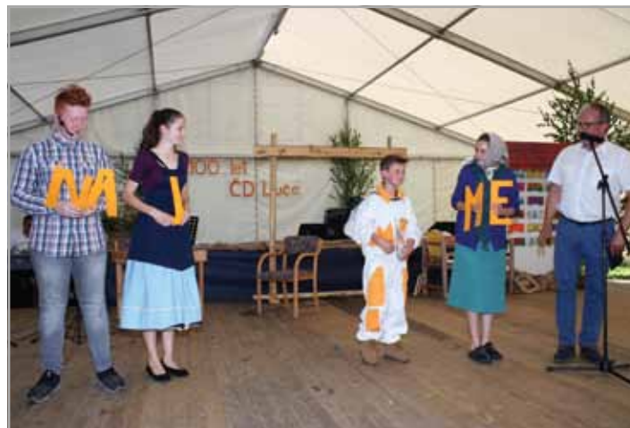
Čebelarstvo je bila osrednja tema spremljevalnega programa učencev osnovne šole