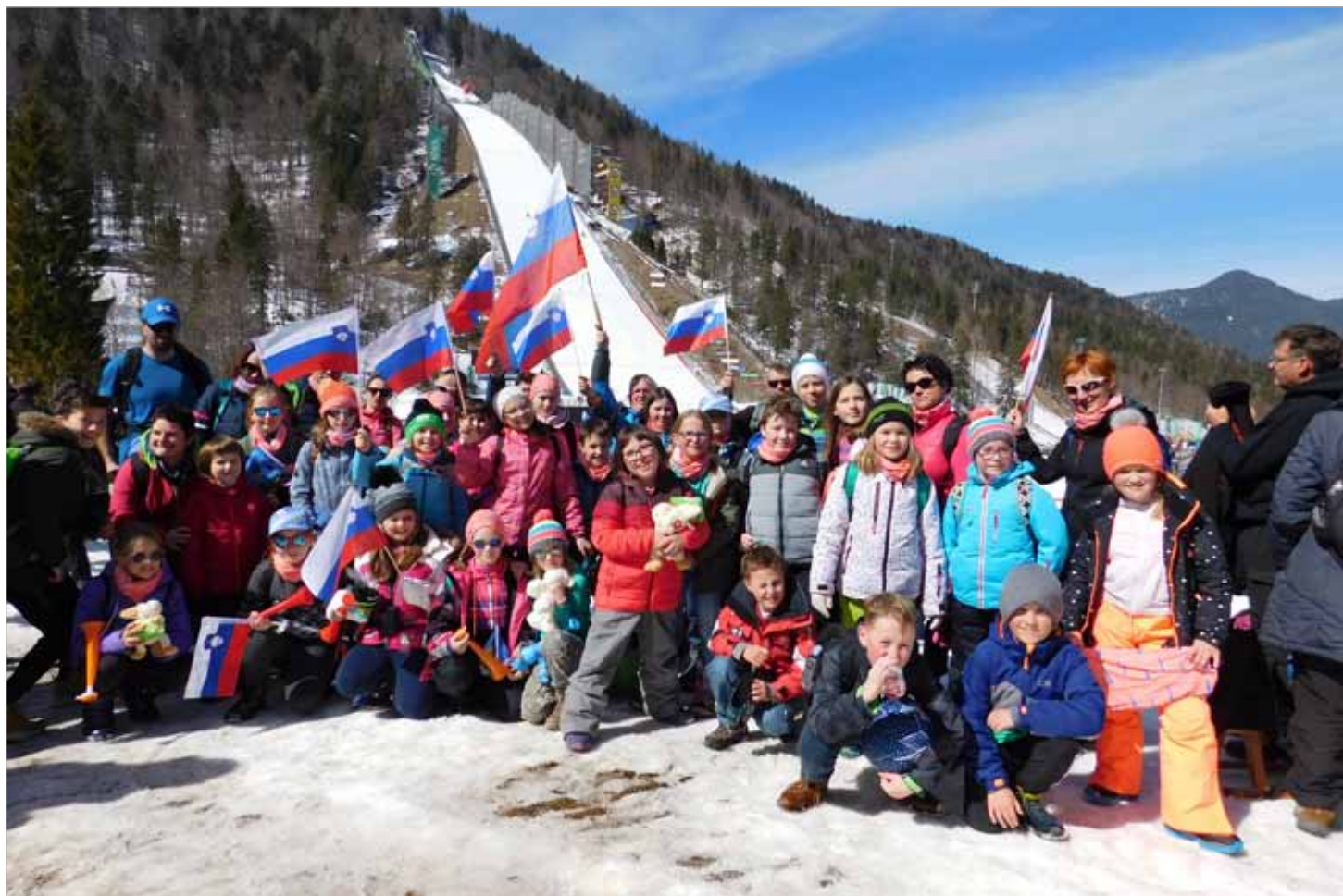
Na ogledu kvalifikacijskega treninga ob zaključku svetovnega pokala v Planici