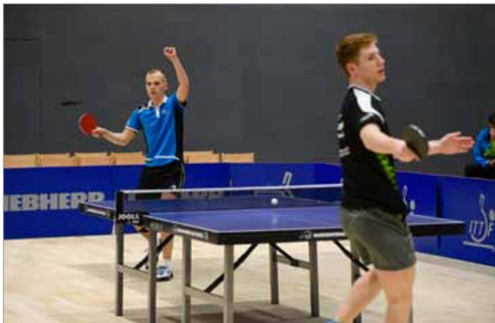
NTK Savinja trenutno zaseda odlično peto mesto v prvi slovenski namiznoteniški ligi