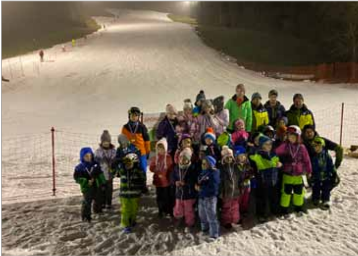
Mali nadebudni smučarji so se učili prvih zavojev

Letošnja zima Smučišču Luče z naravnim snegom in previsokimi temperaturami ni bila naklonjena. Požrtvovalni člani Smučarsko-tekaškega društva Luče so kljub temu uspeli narediti zadostno količino umetnega snega in pripraviti dobro urejeni progi za uspešno in kvalitetno smučanje. Smučišče je obratovalo 52 dni, od 3. januarja do 25. februarja 2020.