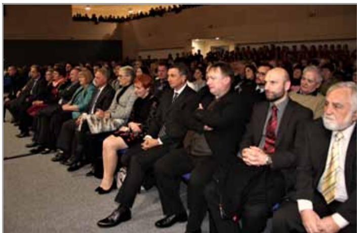
Slovesnosti se je udeležil tudi predsednik Republike Slovenije Borut Pahor

Po dobrem letu in pol gradnje smo 10. januarja 2020 slovesno otvorili Športni center Luče. Veliko število obiskovalcev in ponos nastopajočih je polepšal petkovo popoldne, veliko težo dogodku pa je z udeležbo in s svojim pozitivnim nagovorom ter pohvalo vsem Lučanom dodal predsednik Republike Slovenije, Borut Pahor.