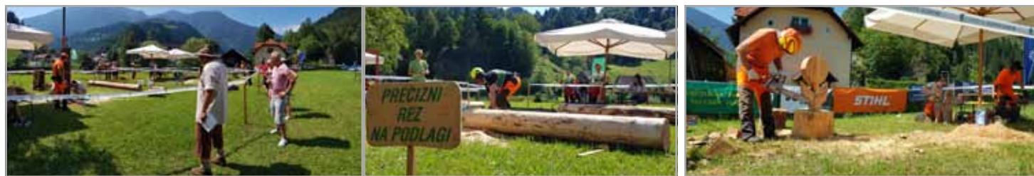
Vlcersko tekmovanje - tradicionalna sekaška tekma in prikaz kiparjenja z motorko