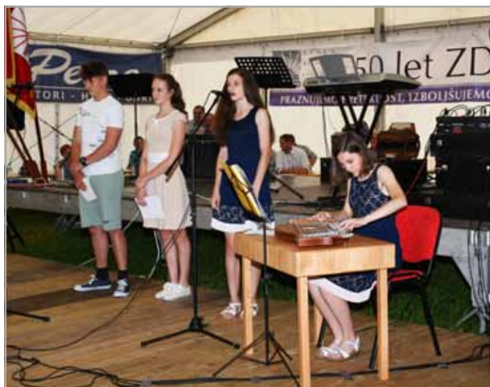
Program prireditve so sooblikovali lučki osnovnošolci