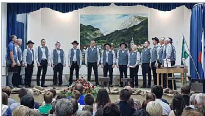
Slovesnost so glasbeno obarvali lučki ljudski pevci

Po kratki hudomušni točki učencev osnovne šole je sledila podelitev Županovih petic. Petice prejmejo učenci, ki so vsa leta osnovnošolskega izobraževanja