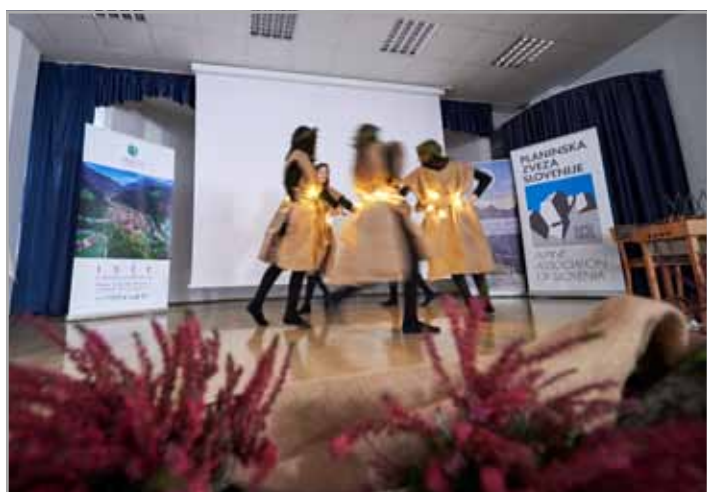
Dobre žalik žene izpod Raduhe so zaplesale vilinsko kolo