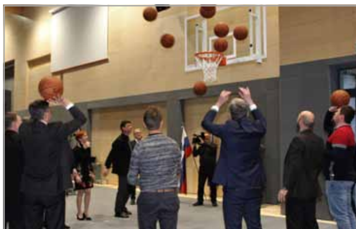
Otvoritev dvorane s prvim simbolnim metom na koš