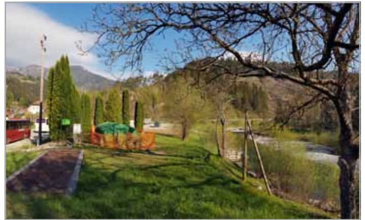
Lokacija nekdanje čistilne naprave bo primerno sanirana in povrnjena v prvotno stanje

tehnologijo, vendar bi bili potem stroški obratovanja večji, kar pa bi pomenilo tudi višje skupne stroške (investicija in obratovalni stroški v življenjski dobi). Skupna investicijska vrednost za čistilno napravo bo znašala približno 300.000,00 EUR brez DDV. Zmogljivost čistilne naprave je 600 PE in ima tako še nekaj rezerve glede na število ljudi v Lučah, tako da bomo lahko nanjo priklopili še preostale objekte.