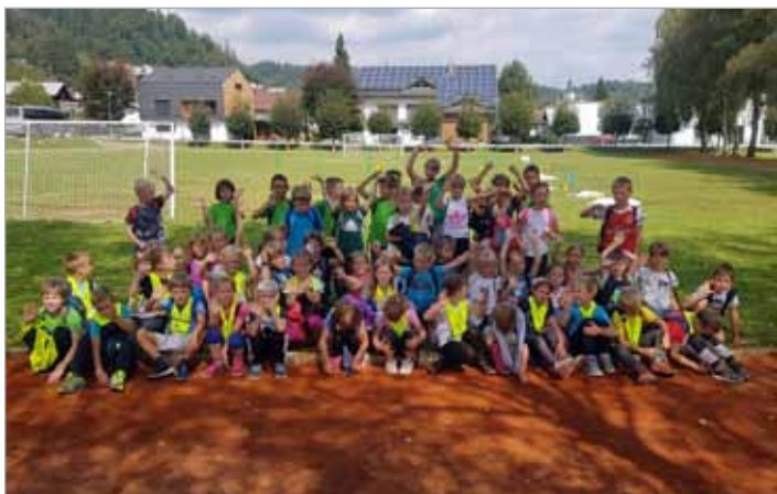
Namen Mini olimpijade je spodbuditi otroke k redni športni aktivnosti

Tako v šoli kot vrtcu smo si tudi v tem šolskem letu zastavili veliko delovnih nalog in verjamem, da jih bomo uspeli realizirati. Prvi uspehi so že tu - 32 učencev je osvojilo bronasta priznanja na tekmovanju iz logike, 8 na tekmovanju iz biologije, starejše deklice so prvakinja Zgornje Savinjske doline v nogometu, fantje pa so bili tretji.