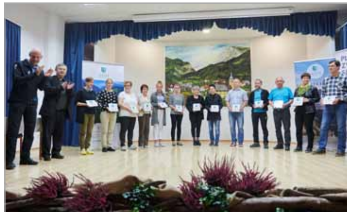
K projektu je pristopilo kar trinajst partnerjev