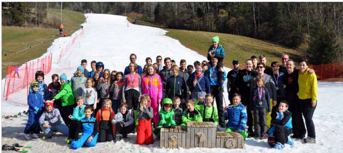
Udeleženci februarske smučarske tekme za mladino in mentorje Zgornje Savinjske doline na Smučišču Luče