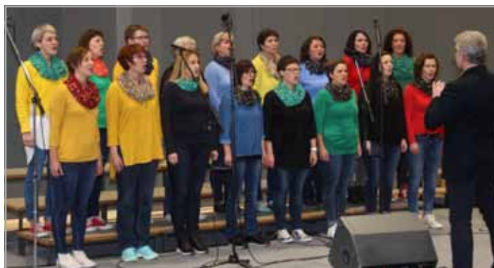
Učiteljski pevski zbor OŠ Blaža Arniča Luče