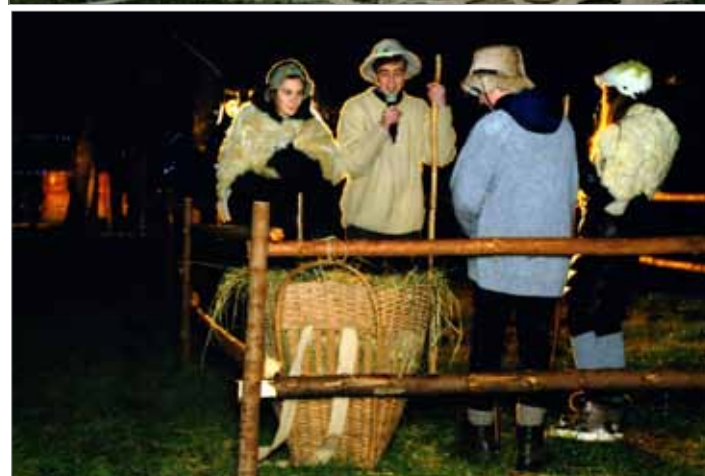
Projekt je povezal generaciji mlajših in starejših Lučanov

Uprizoritvi živih jaslic sta bili v sredo, 25. decembra, in v petek, 27. decembra, obakrat ob 18. uri. Velika množica obiskovalcev vseh starosti se je z baklami dvajset minut prej pridružila pastirjem na sprehodu od gasilskega doma po poti ob Savinji do prizorišča. Po oceni je bilo na prizorišču vsaj 700 obiskovalcev. Prvič uprizorjena zgodba v čudovitem ambientu pri etno hiškah in skorjevki na Prodah je bila res nekaj posebnega. Ob izbranih božičnih pesmih in glasbi je v soju reflektorjev, bakel in luči skupina nastopajočih v »naši« božični zgodbi pričarala živo svetopisemsko dogajanje ob velikem rojstvu.