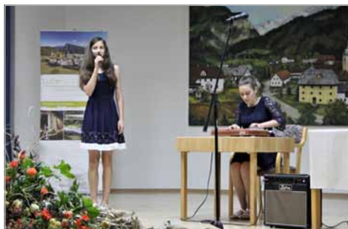
Spremljevalni kulturni program je bil domislj preplet glasbe, petja in pripovedi

Župan Občine Luče je na otvoritveni slovesnosti podpisal tudi Zeleno politiko, glavni pristopni dokument k projektu Zelene sheme slovenskega turizma. V dneh festivala pa so bile v naši občini organizirane še druge dejavnosti; predavanje o raziskovanju podzemeljskega sveta v Kamniško-Savinjskih Alpah, dan odprtih vrat v rokodelski etno vasici ter Kresna noč.