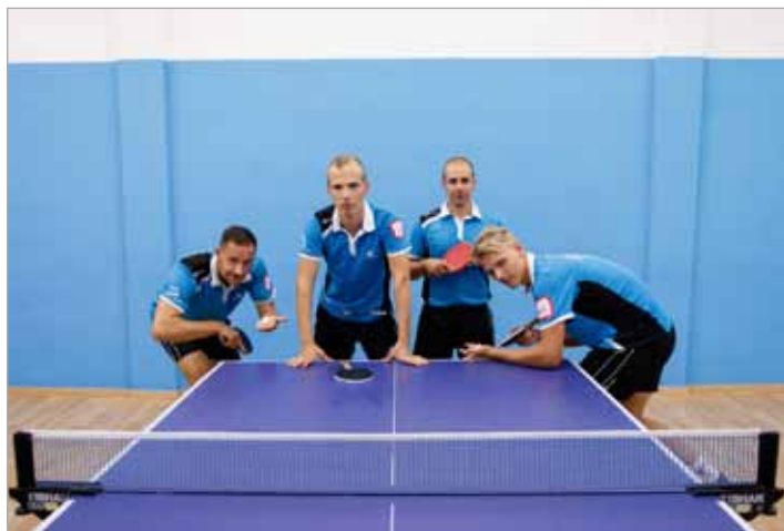
Članska ekipa NTK Savinja