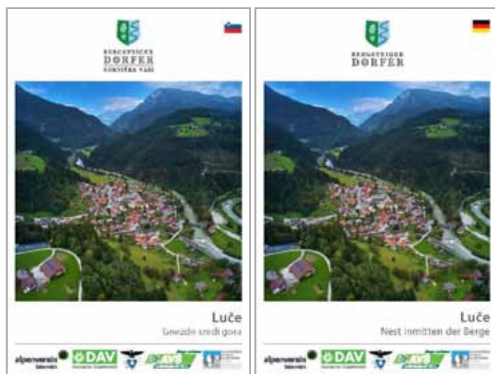
Nova brošura je na voljo v dveh jezikovnih različicah