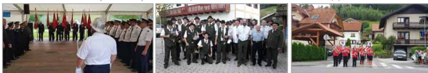
Slovesni prevzem novega gasilskega vozila