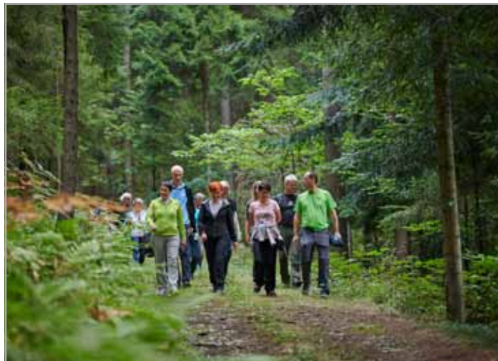
Obiskovalci so se po pogostitvi podali na krajši pohod okrog vasi ...